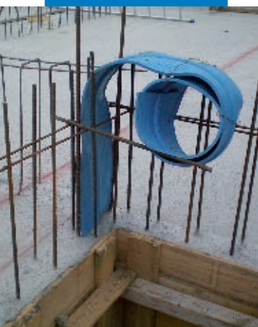
Junta estructural en muro de concreto. Banda de PVC embebida en la losa de cimentación, después del colado del concreto