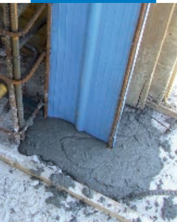
Idrostop PVC BI embebido en la losa de cimentación con Planigrout, tras demoler parte de la losa