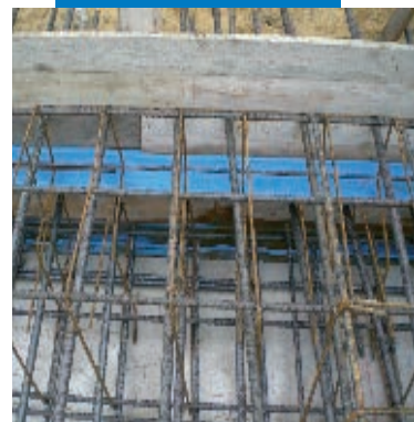
Sellado de una junta estructural en una cimentación