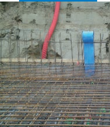
Junta estructural en muro de concreto. Preparación con banda de PVC embebida en la losa de cimentación, previo al colado del concreto