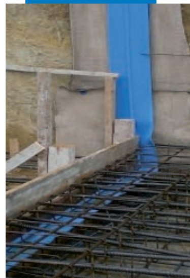
Sellado de una junta estructural en un muro vertical

Las referencias relativas a este producto están disponibles bajo solicitud y en la web de Mapei www.mapei.mx y www.mapei.com